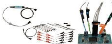
PBL100 & PBL250 逻辑探头

某些情况下, 高输入阻抗非常重要。横河提供两个型号的逻辑探头——PBL100 (100 MHz), 具有最小负载; PBL250, 探测高速逻辑波形的理想工具。